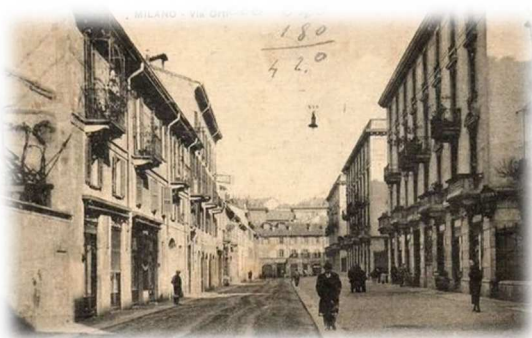
Via Orti, 1919

La Fondazione Moscati si trova nel cuore di Milano, AREA C, in una delle vie storiche della città: Via Orti, civico 27.