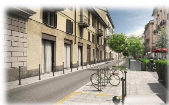
Via Orti 2021